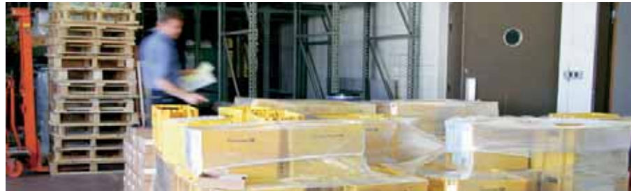
Oft wird es eng in der Spedition

Folgerichtig kümmert sich die Spedi darum, dass die Lieferaufträge termingerecht den Transporteuren übermittelt werden. Damit diese die Ware zügig verladen können und auch während der Fahrt den Drucksachen kein Eckchen gekrümmt wird, muss alles zuerst sauber und stabil verpackt und palet-